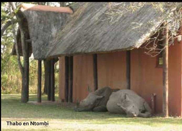
Thabo en Ntombi