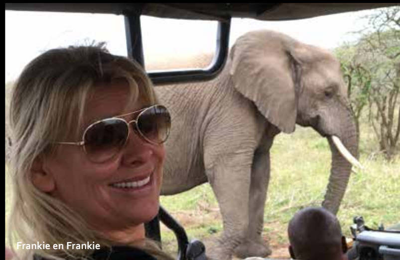
Frankie en Frankie

'Het mooiste boek over de Afrikaanse bush sinds Born Free' - Daily Mail