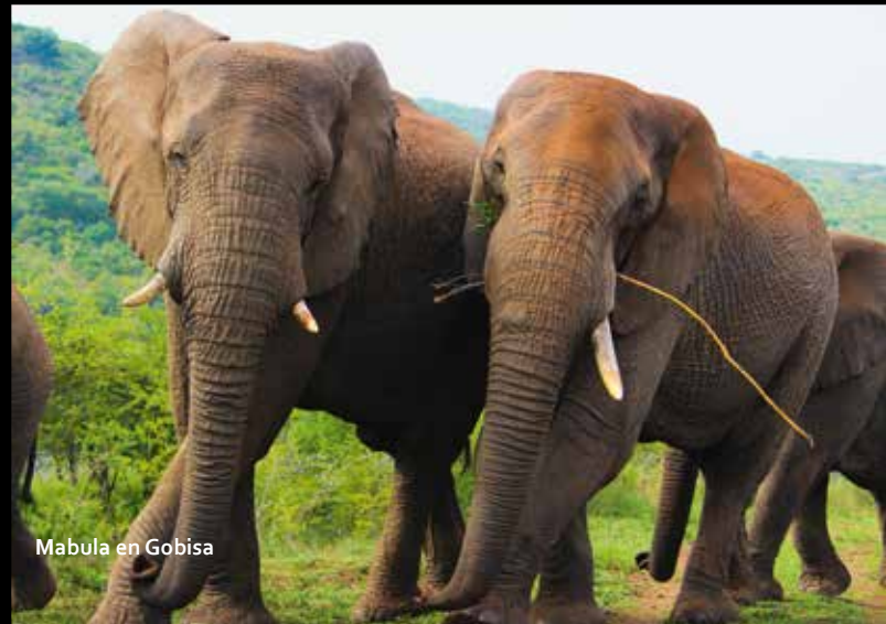
Mabula en Gobisa