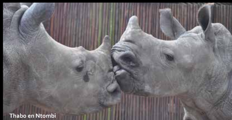
Thabo en Ntombi

'Het mooiste boek over de Afrikaanse bush sinds Born Free' - Daily Mail