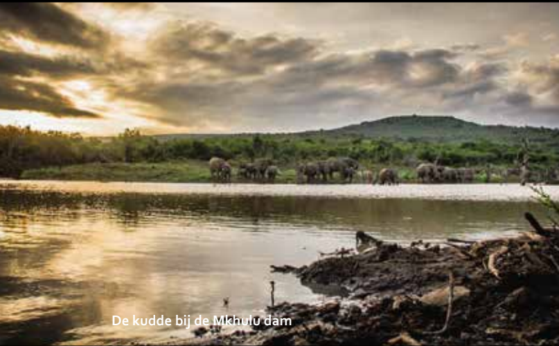
De kudde bij de Mkhulu dam

'Thula Thula is de plaats waar de passie van één man en zijn vertrouwen in het herstel van de relatie tussen mens en dier, ertoe leidden dat hij wereldwijd bekend werd als de 'Olifantenfluisteraar'